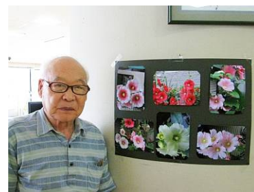
写真家としての一面もある塚目さん。