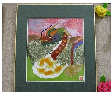
辰年にちなんだ龍のちぎり絵